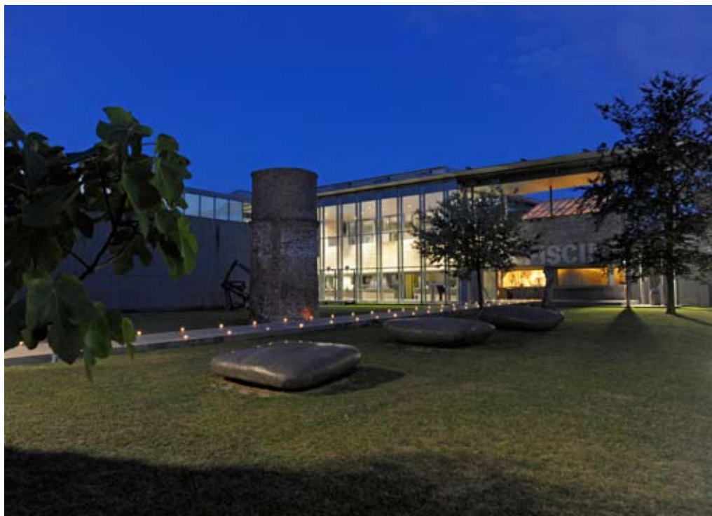
Architectes : Albert Baert, 1932 / Jean-Paul Philippon, 2001

le CNAP, La Piscine affiche un choix dans cette collection de meubles sur les podiums design installés derrière le lion et propose un signe de reconnaissance pour identifier, à côté des cartels documentaires, les dépôts du CNAP dans le parcours du visiteur, mettant ainsi en évidence cette relation forte entre le musée et les collections nationales.